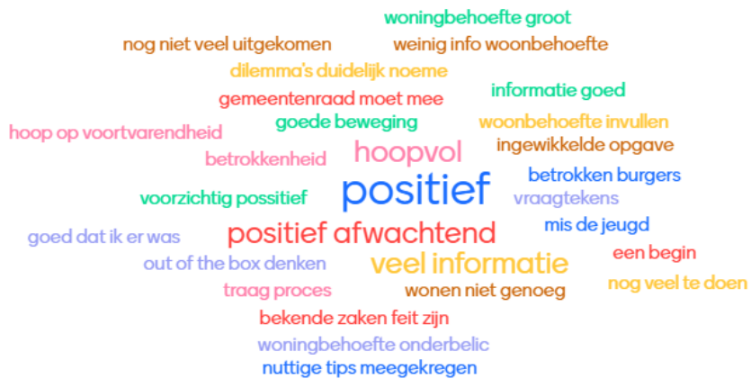
Afbeelding 5: Vraag aan publiek: Kijken naar het centrum van Baarlo: waar ben je trots op?