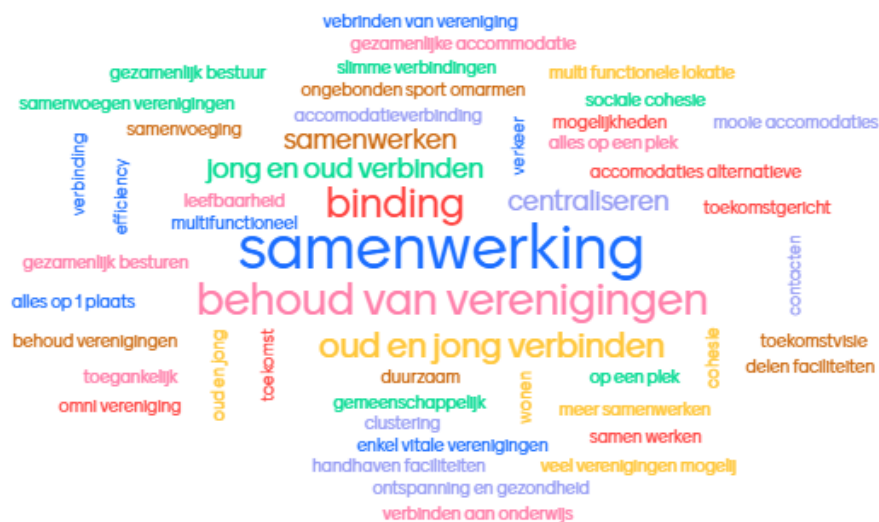
Afbeelding 3: Vraag aan publiek: Welke kansen zie je rondom het verenigingsleven in Baarlo?

De volgende vraag is aan het publiek gesteld: 'Welke kansen zie je rondom het verenigingsleven in Baarlo?' Hier komt samenwerking, binding (tussen jong en oud) en het behoud van verenigingen sterk naar voren.