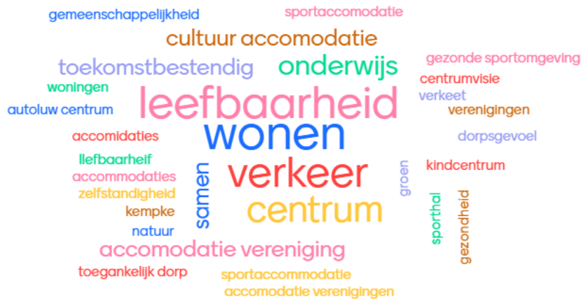
Afbeelding 2: Vraag aan publiek: Waar ligt voor jou de grootste prioriteit?

Het eindresultaat van dit proces zal moeten zijn: